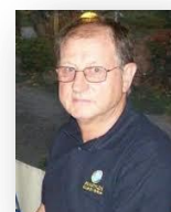
di Salvatore Seno