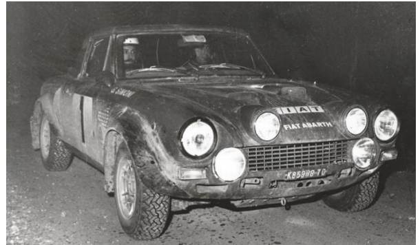
La vittoriosa Fiat 124 Abarth